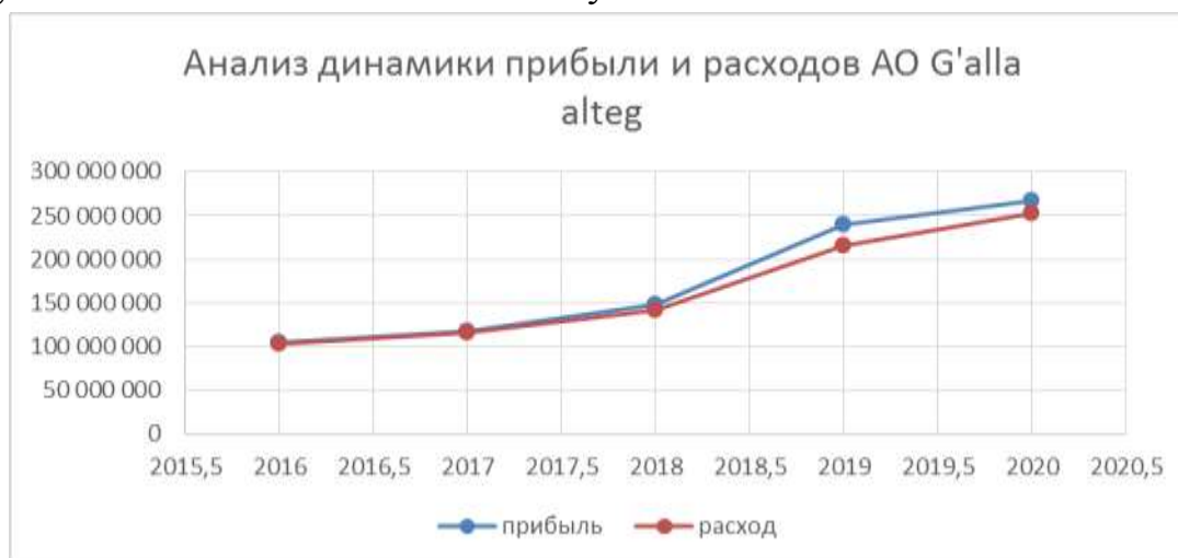
Рисунок №3 Анализ динамики прибыли и расходов АО «G'alla alteg».

Та же тенденция повторяется и АО «G'alla alteg», расхода в течении пяти лет увеличились на 149 019 747 млн сум.