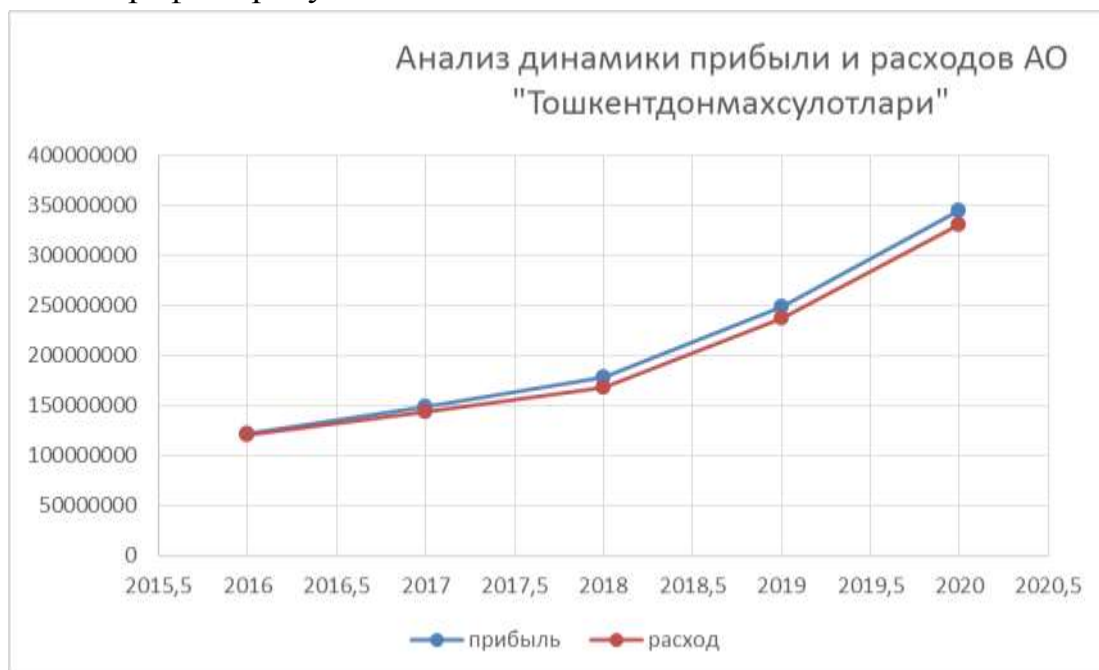
Рисунок №2. Анализ динамики прибыли и расходов АО «Тошкентдонмахсулотлари»

Если рассматривать данные показатели, то можно обратить внимание, что прибыль растёт соответственно растут и расходы. Более наглядно это можно увидеть на графике рисунок №2.